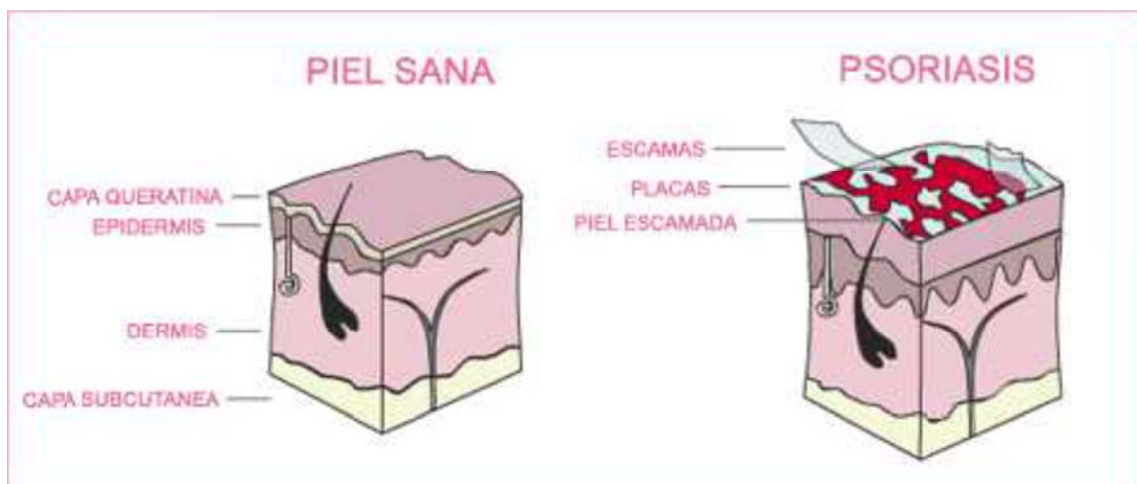
Imagen comparativa de una piel sana y otra de un paciente que padece psoriasis

Se pueden distinguir tres tipos de psoriasis: Psoriasis ordinaria (Psoriasis vulgaris), psoriasis con ampollas (Psoriasis pustulosa) y psoriasis-artritis.